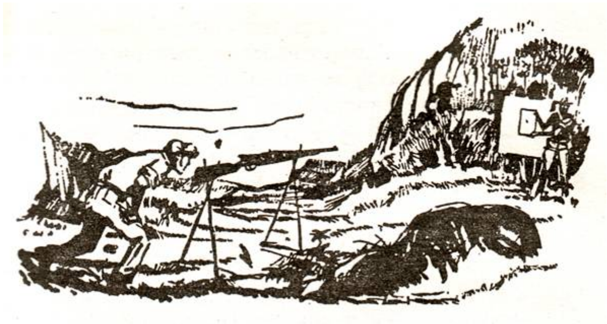
5. ábra. Lőoktatás.

A lökiképzés - az újoncok iskolájának fő tantárgya. A partizánnak jól kell lőnie, és közben a lehető legkevesebb lőszert kell felhasználnia. A lövész kiképzés oktatása avval kezdődik, hogy az újoncot megtanítják arra, hogyan kell helyesen célozni a kézi lőfegyverekből. Erre a célra egy egyszerű berendezést használunk, ami négy keresztbetett karból áll, amire a puskát fektetjük, és mozdulatlanul rögzítjük. Ezt a szerkezetet néhány lépésnyi távolságra állítjuk fel, egy mozdulatlan céllap elé. A céllap mellé egy másik újoncot állítunk, amely a kezében tartja a céltáblát. A céllapra átvetített kontrol pont bejelöléséhez megparancsoljuk az újoncnak, hogy tegye a céltáblát a céllapra, majd erre irányítani a fegyvert. Mindeközben a puska mozdulatlan marad, és csak a céltáblát mozgatjuk. A célra tartást háromszor hajtjuk végre, méghozzá a céltáblát minden egyes alkalommal máshová mozdítjuk. Ha három célpróba után a kontrol pontok és a céltábla egybeesnek, akkor az eredmény kiválónak minősül (5. ábra).