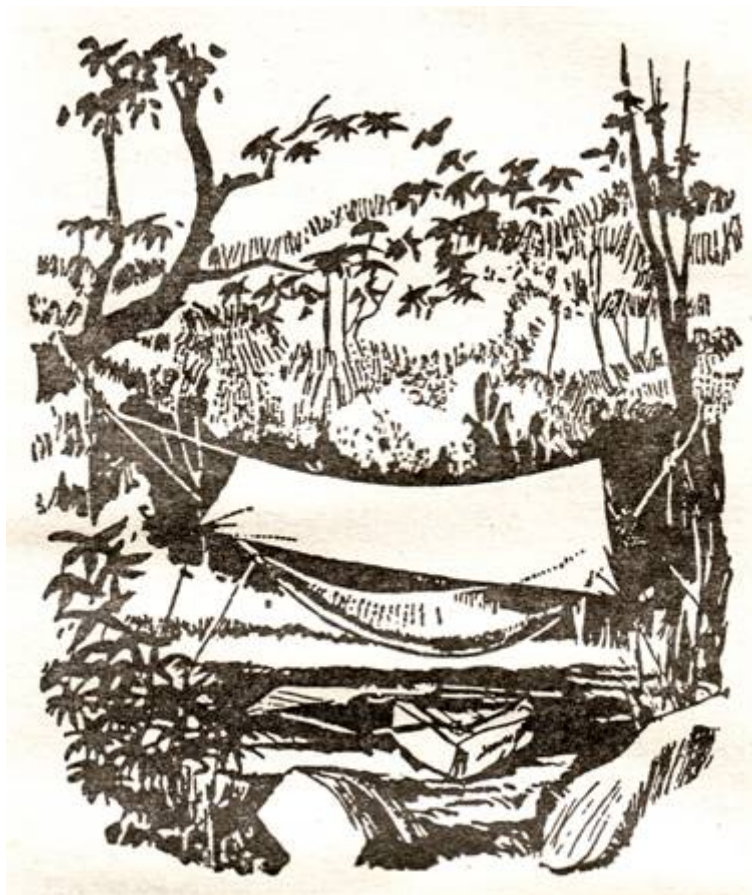
1. ábra. A nejlón vízhatlan tetővel ellátott függőágy.

Továbbá, szükség van egy takaróra, mivel a hegyekben a sötétség beálltával nagyon lehűl a levegő. Ezenkívül szükséges egy meleg kabát, amely segít elviselni a hőmérséklet ingadozásait. A partizán ruházata nadrágból és egyszerű munkásingből áll, legyen az akár katonai ing, vagy egyéb más. A lábbelinek erősnek kell lennie; a legelső tárgy, amiből tartalékkal kell rendelkezni - a bakancs, mivel nélküle a terepen roppant nehéz.