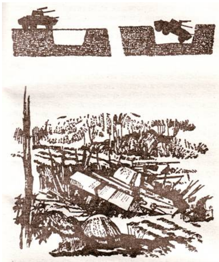
3. ábra. Tankcsapda.

A gyengén szabdal terepen az ellenséges csapatok nyitott gépkocsikon is szokott közlekedni. A hadoszlop elején általában néhány harckocsi vagy páncélkocsi halad, majd ezek után - a gyalogság, teherautókon. A partizáncsoport rendelkezésére álló erőktől függően vagy be lehet keríteni az ellenség egész hadoszlopát, vagy jelentős veszteségeket okozni, megtámadva valamely teherautót, és ezzel egy időben felrobbantani az aknákat. Ebben az esetben gyorsan kell cselekedni, összeszedni a megölt ellenséges katonák fegyvereit, és visszavonulni. Ha a lehetőségek engedik, végre lehet hajtani a teljes bekerítést, mint ahogyan arra már korábban rámutattunk, betartva az adott harci forma minden általános szabályát.