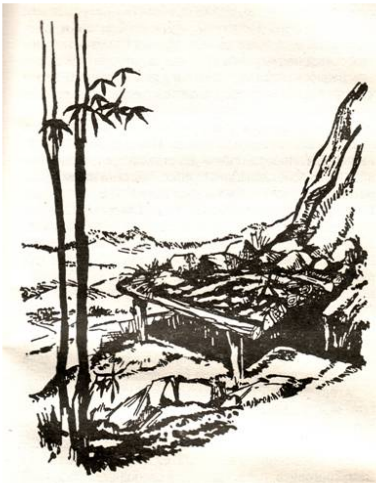
4. ábra. Óvóhely, aknavető tűz esetére.

A partizánháborúban nem létezik nyilvánvaló és jól kivehető frontvonal. A frontvonal - többé-kevésbé elméleti fogalom; figyelembe kell venni, hogy ez, általában, legnagyobb, legkifejezőbb mértékben alkalmazkodó, mozgatható jelleggel bír, ráadásul mindkét harcoló fél nagyobb nehézségek nélkül átszivároghat rajta.